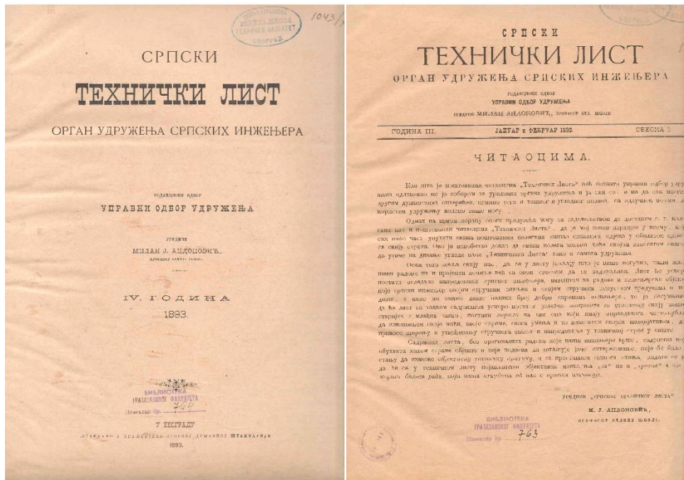
Српски технички лист, уредник Милан Ј. Андоновић, 1893. (Библиотека Грађевинског факултета)